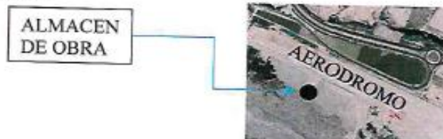
Figura 1 Ubicación del emplazamiento de obra (Punto Negro)

El lugar de entrega del bien será en ALMACÉN DE OBRA , referencia: Playa aviación. Colindante al aeródromo