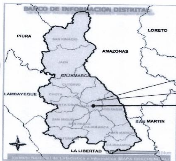
Imagen N° 01 – Ubicación Geográfica: Provincia Hualgayoc – Distrito de Hualgayoc