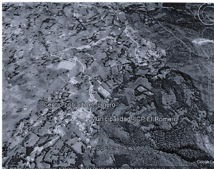
Imagen 01: Fotografía satelital, referencial, de la zona del proyecto.