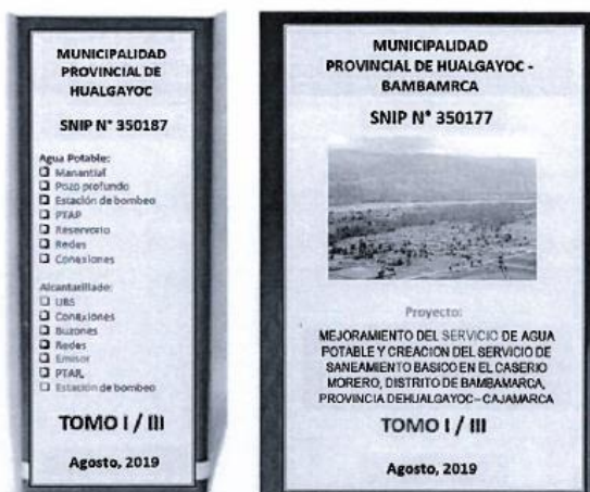
Figura 01: Forma de Presentación del Expediente Técnico (Referencial)

verificación. Se recomienda que dichas carátulas, deberán indicar como mínimo, lo indicado en la figura 1.