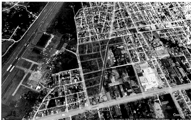
Vista Satelital de Ubicación del Proyecto