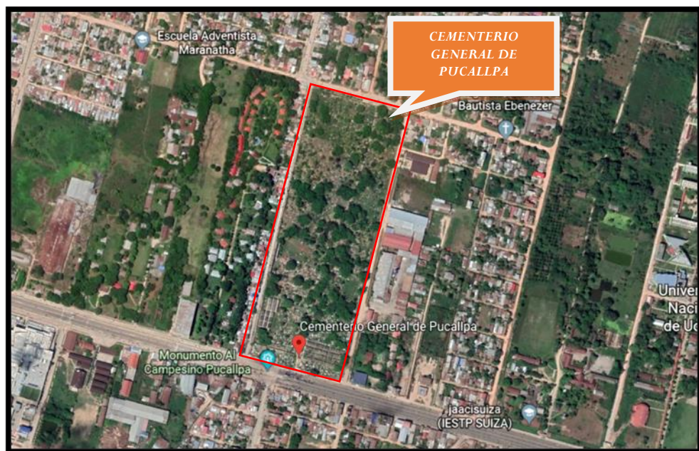
Fig. N° 01: Ubicación del proyecto