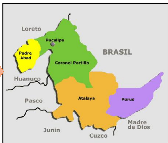
Mapa macro localización del departamento de Ucayali