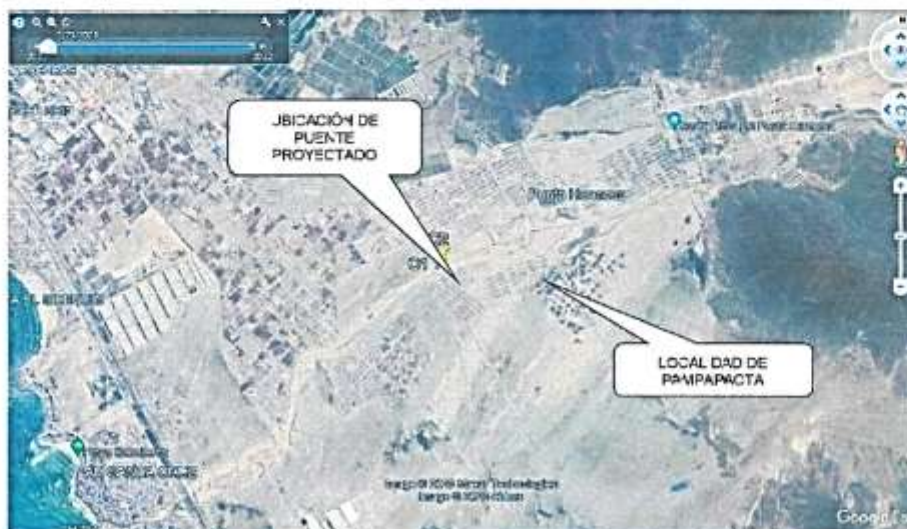
Figura N° 02 Localización del proyecto

En esta vista se aprecia la ubicación de la proyección de la estructura de Fuente de Concreto, en la localidad de Pampapacta.