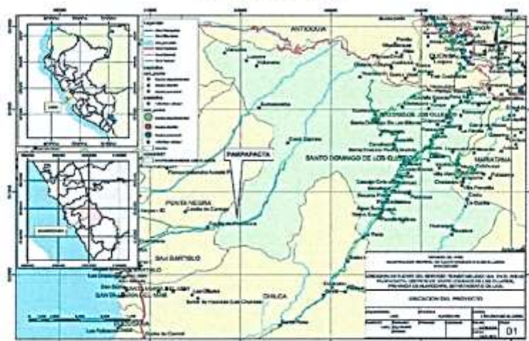
Figura N° 01 Ubicación del proyecto

La localización de la carretera proyectada está dentro de las siguientes coordenadas, según Datum WGS84 Zone 18.