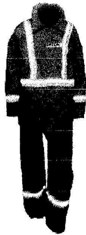
Uniforme de Mantenimiento