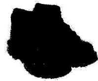
Zapatos de Seguridad con Puntera de Acero