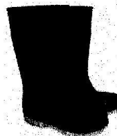
Botas de Jefe