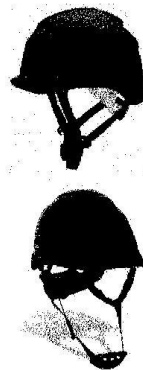
Casco de Seguridad