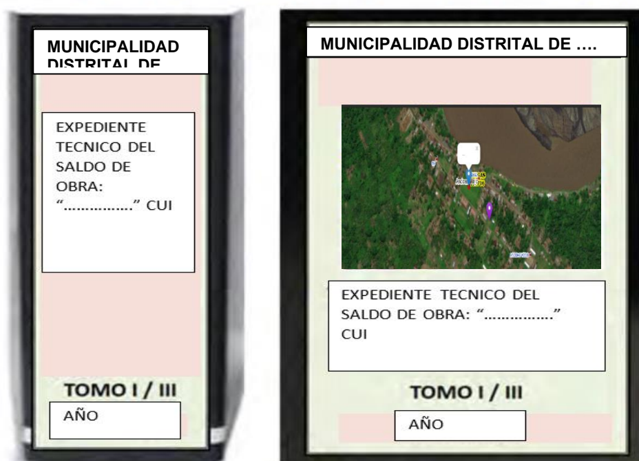
Figura 1. Forma de presentación del Expediente (ejemplo)

Nota. - Cada uno de los documentos que conforman el Expediente Técnico, deberá estar firmado por el Ingeniero jefe de Proyecto y los Ingenieros Especialistas responsable de su ejecución.