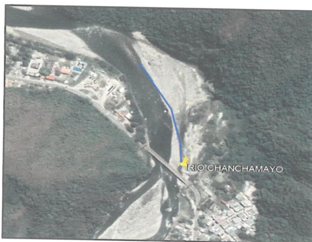
CROQUIS DEL TRAMO A INTERVENIR