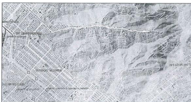
Imagen 1: Ubicación del proyecto en el Distrito de San Juan de Lurigancho.