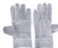
GUANTES DE CUERO

Para determinar que los postores cuentan con las capacidades necesarias para ejecutar el contrato, el órgano encargado de las contrataciones o el comité de selección, según corresponda, incorpora los requisitos de calificación previstos por el área usuaria en el requerimiento, no pudiendo incluirse requisitos adicionales, ni distintos a los siguientes: