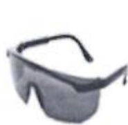
LENTES DE SEGURIDAD