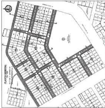
Figura N° 1: Límites del Asentamiento Humano Los Alamos.