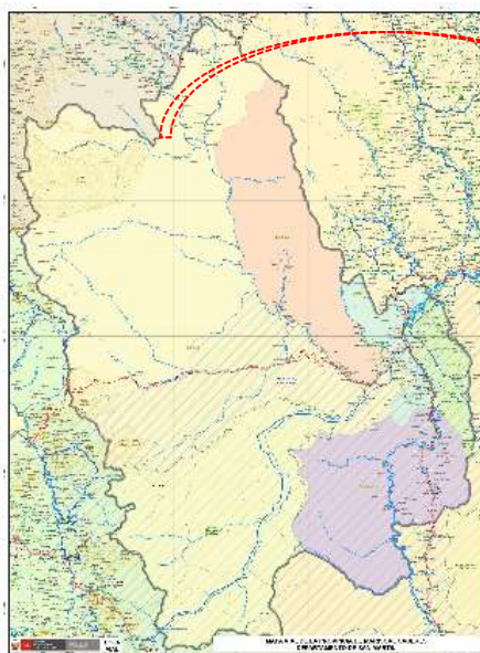
Ilustración N° 03: Mapa de la provincia de Moyobamba