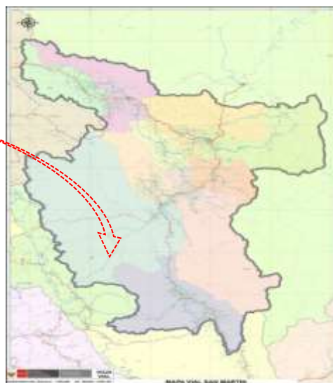
Ilustración N° 02: Mapa del departamento San Martín