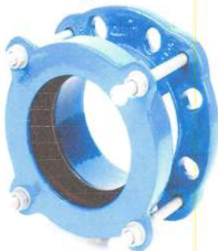
UNION DRESSER H°D° PARA TUBERIA PVC Y HDPE 63 MM

"Año del Bicentenario, de la Consolidación de Nuestra Independencia, y de la Conmemoración de las Heroicas Batallas de Junín y Ayacucho"