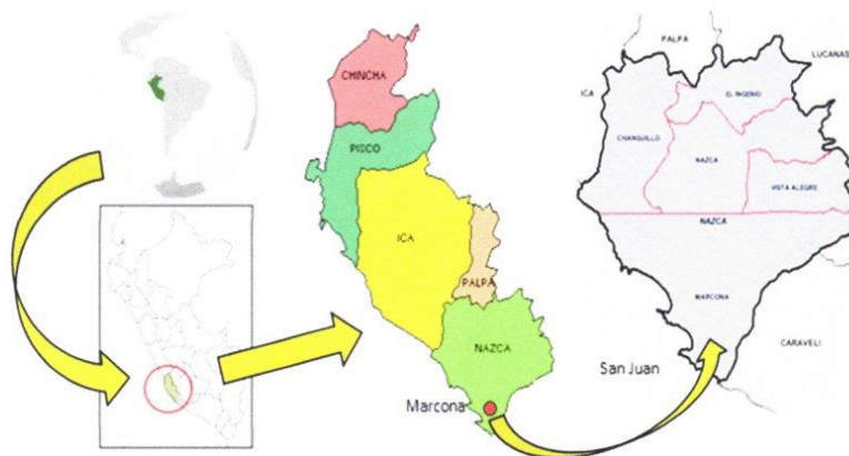
IMAGEN N° 01 - ESQUEMA DE LOCALIZACIÓN DEL PROYECTO