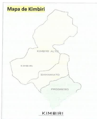
Mapa de Kimbiri