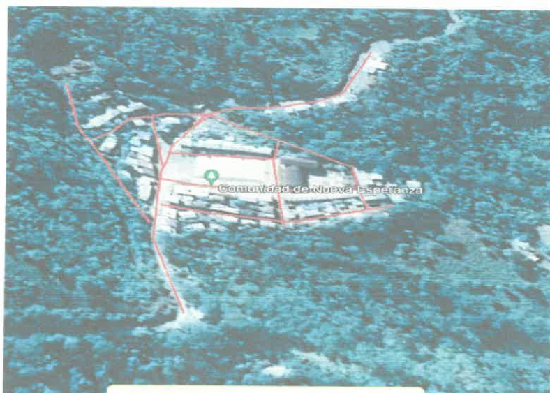
Área de Influencia del proyecto en Kimbiri