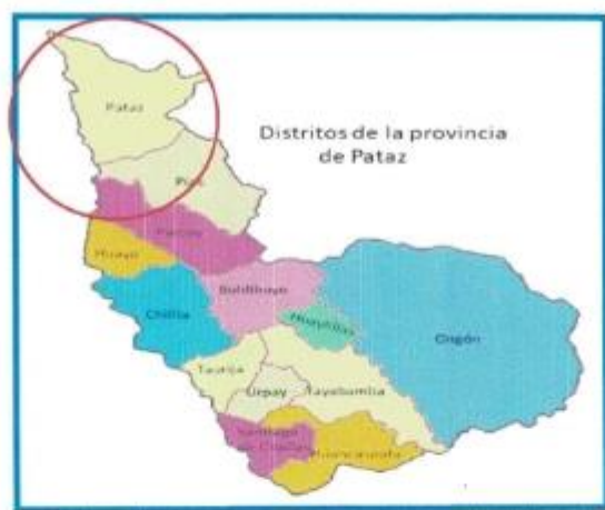
IMAGEN N° 02: DISTRITO DE PATAZ EN LA PROVINCIA DE PATAZ