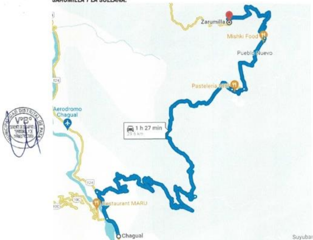
IMAGEN N° 7: VÍA DE ACCESO DESDE LA CIUDAD DE CHAGUAL PATAZ, PUEBLO NUEVO SARUMILLA Y LA SULLANA.