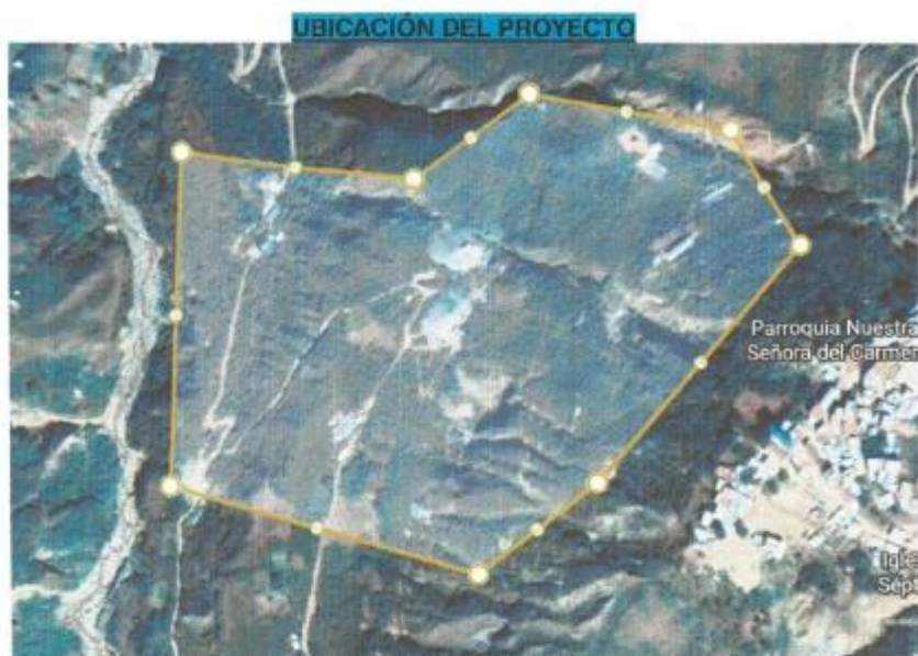
IMAGEN N° 04: UBICACIÓN DEL PROYECTO EN LA LOCALIDAD DE LA SULLANA