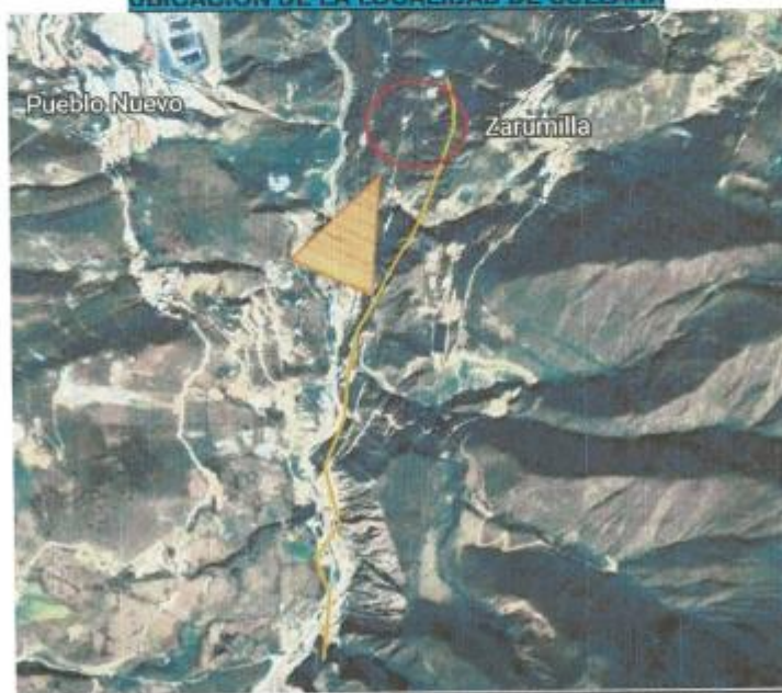
IMAGEN N° 03: UBICACIÓN DE LA CAPTACION A LA SULLANA