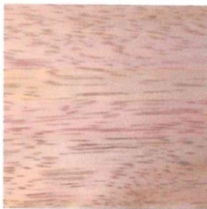
MACHIHEBRADO(AGUANO)- IMAGEN REFERENCIAL

Año del Bicentenario de la consolidación de nuestra independencia y de la conmemoración de las heroicas batallas de Junín y Ayacucho