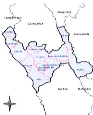
Ilustración 2: Mapa del departamento de La Libertad