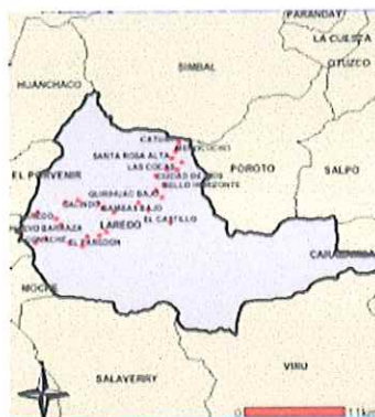
Ilustración 4: Mapa del distrito de Laredo