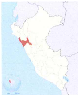
Ilustración 1: Mapa macro de la localización del Perú