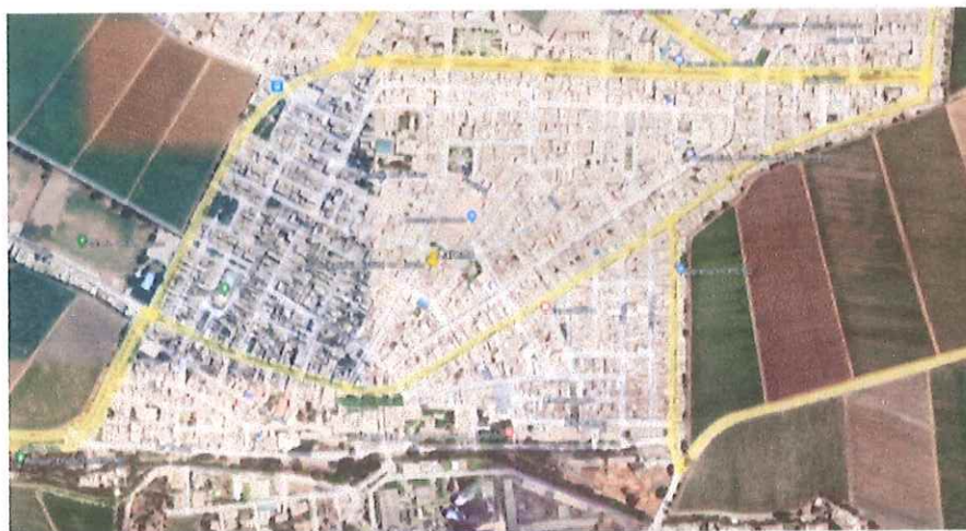
Ilustración 5: Distrito de Laredo