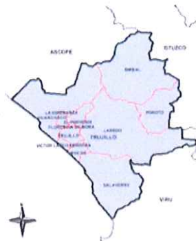
Ilustración 3: Mapa de la provincia de Trujillo