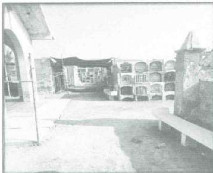
Foto N° 05 y 06.- Se Muestra que el pabellón N°05 de la parte frontal y del pasadizo se encuentra en condiciones que no son las adecuadas, generando malestar a la población.