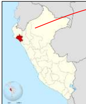
Ubicación del Departamento