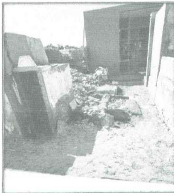
Foto N° 01 y 02.- Se Muestra que el Pabellón N°03 de la parte frontal y posterior se encuentra en condiciones que no son las adecuadas.