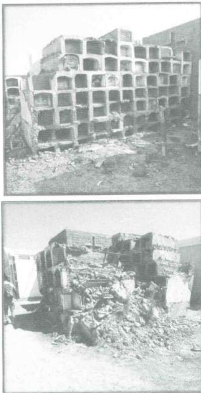
Foto N° 03 y 04.- Se Muestra que el pabellón N°04 de la parte frontal y posterior se encuentra en condiciones que no son las adecuadas