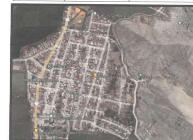
Vista satelital de la localización del proyecto, en la imagen se muestra LA I.E 88331, la cual tiene las coordenadas UTM mencionadas en el cuadro superior.