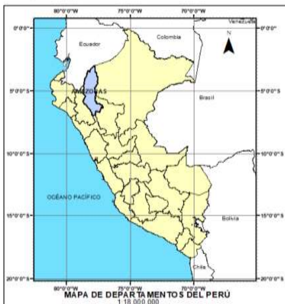
Figura 3.1 Mapa de departamentos del Perú