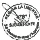
GRÁFICO N° 01