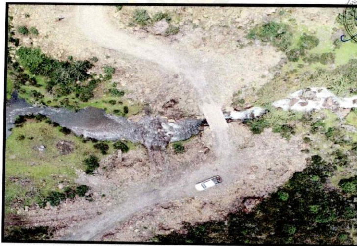
Vista del estado actual del puente Upamayo

Actualmente, el Puente Upamayo está en funcionamiento, pero con MUCHAS DEFICIENCIAS ESTRUCTURALES DEBIDO A LA AUSENCIA DE ASESORAMIENTO TECNICO Y ERRORES EN EL PROCESO CONSTRUCTIVO , siendo estos los problemas más relevantes detectados en la estructura del puente, a ello la suma la antigüedad de los elementos del puente.