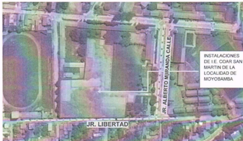
Imagen 2: Mapa de Ubicación satelital

Términos de Referencia de la Contratación de la Ejecución de la obra IOARR: "Reparación de Aula de Educación Secundaria, Ambiente de Residencia, Ambiente de Administración y/o Gestión Pedagógica y Servicios Higiénicos y/o Vestidores, Además de otros Activos en el (la) I.E. COAR San Martín de la Localidad de Moyobamba, Distrito de Moyobamba, Provincia de Moyobamba, Departamento de San Martín" Con CUI N°2576390