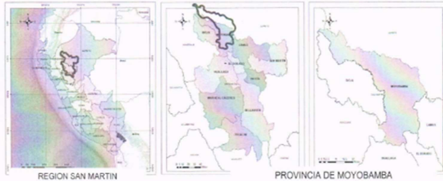
REGION SAN MARTIN