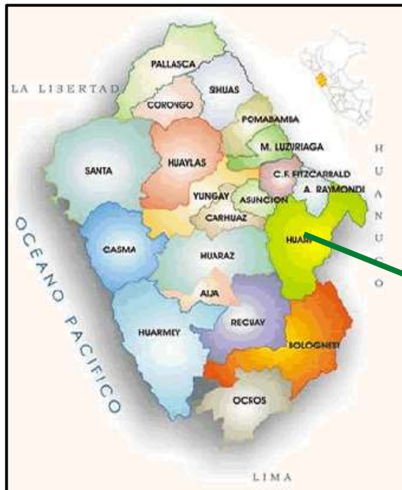
Departamento de Ancash