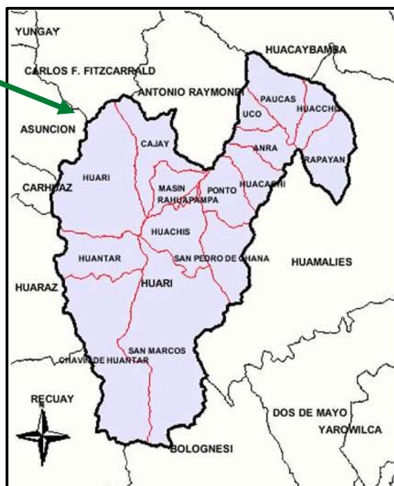
Provincia de Huarí

Las características y ubicación del tramo de la vía a intervenir se muestran a continuación: