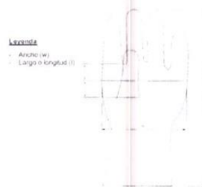
Figura referencial: Puntos de medición para espesor del guante