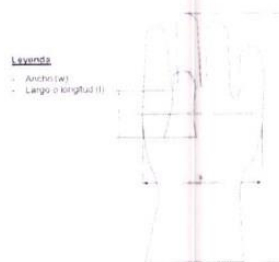
Figura referencial: Puntos de medición para espesor del guante