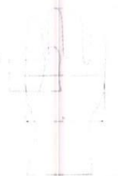
Figura referencial: Puntos de medición para espesor del guante