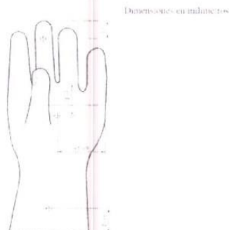
Figura referencial: Puntos de medición para espesor del guante

NOTA: La distancia de 45 mm ± 9 mm se localiza aproximadamente en el centro de la palma para guantes de diferente tamaño.