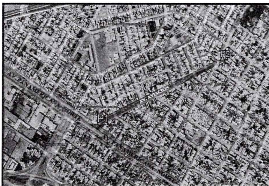
VISTA PANORÁMICA DEL AREA DE ESTUDIO