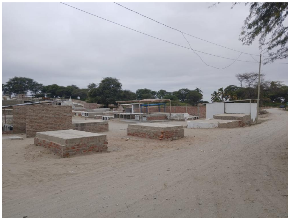
Fig04. En esta imagen se aprecia la falta de cerco perimétrico en aproximadamente 90% del perímetro del cementerio.