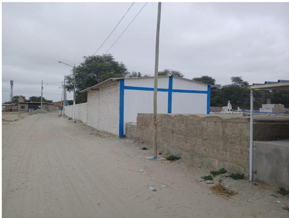
Fig05. En esta imagen se aprecia en algunas partes cerco perimétrico del cementerio.