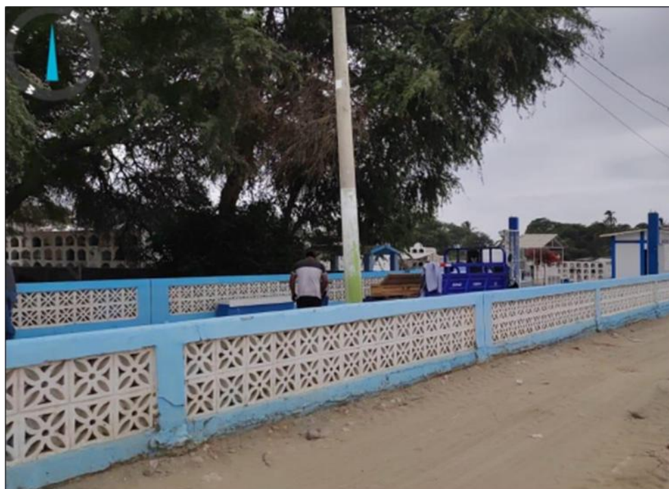
Fig03. En esta imagen se aprecia el parapeto en mal estado.