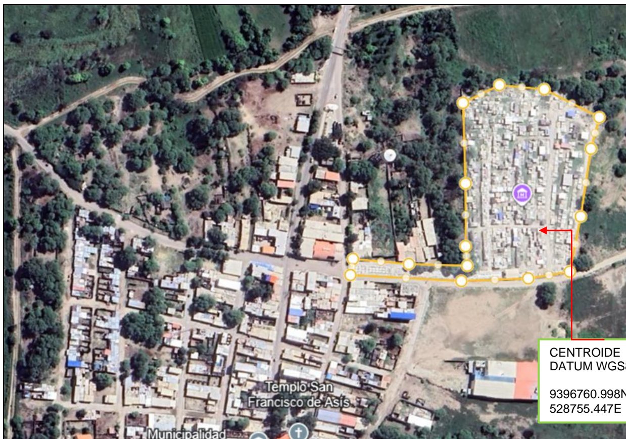
Fig03. UBICACIÓN SATELITAL DEL PROYECTO