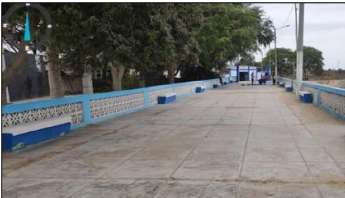
Fig01. Infraestructura de accesos al Cementerio San José de Bernal (pisos, parapetos, sardineles) presentan grietas y fisuras sin ningún tipo de mantenimiento