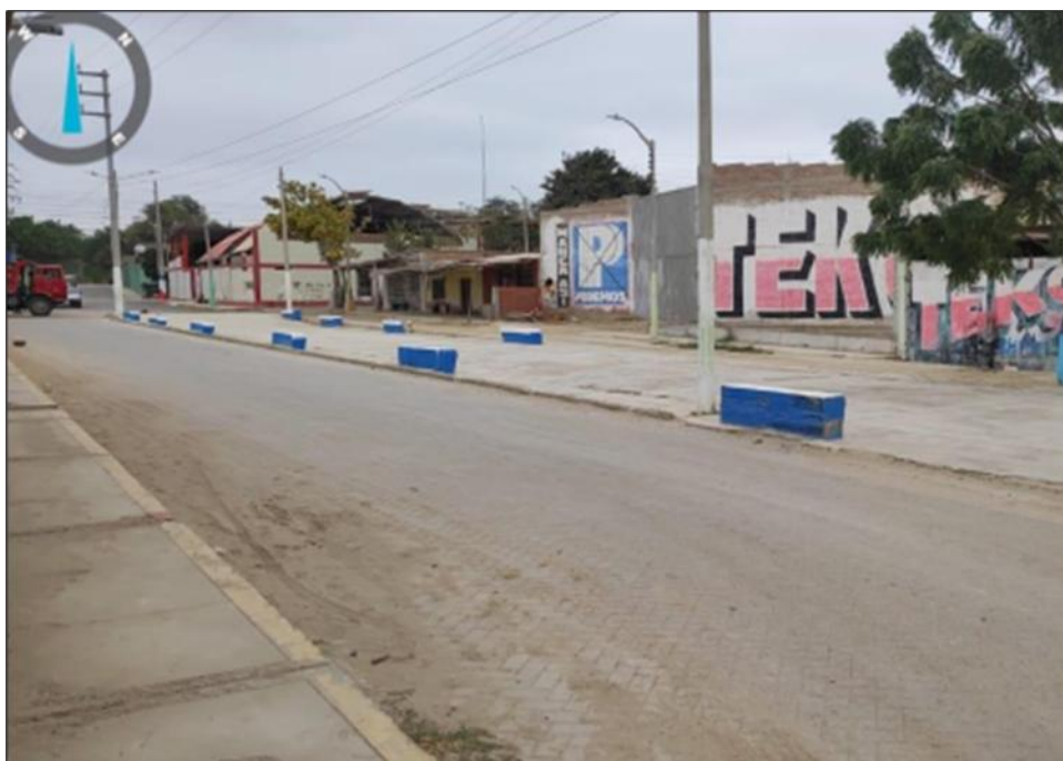
Fig02. Infraestructura interior de la alameda cuenta con bancas agrietadas y en mal estado y no cuentan con área verde.