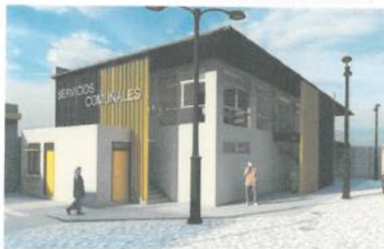
Vista del Proyecto