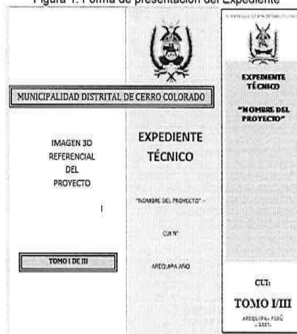
Figura 1. Forma de presentación del Expediente

Los expedientes deberán ser presentados en archivadores de palanca de lomo ancho. Cada archivador deberá considerar una carátula en la parte frontal y en lomo del mismo, para una rápida verificación. Se recomienda que dichas carátulas, deberán indicar como mínimo, lo indicado en la figura 1.