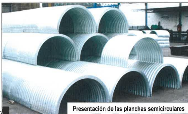
Presentación de las planchas semicirculares

El producto final posee una capa de recubrimiento de zinc UNIFORME en toda la plancha corrugada. El acabado debe ser liso, de tal forma que no existan grumos o zonas con mala adherencia del zinc al metal base (exfoliaciones, desprendimiento de zinc, gotas, etc)