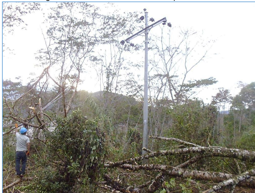
Fig. 3. Postes continuamente se desploman