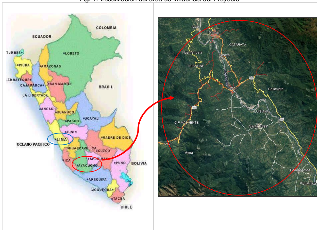
Fig. 1. Localización del área de influencia del Proyecto