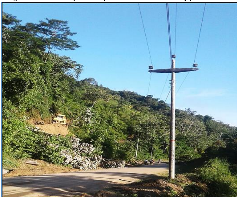
Fig. 2. Postes de LP y RP con presencia de crucetas muy pesadas