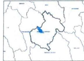
MAPA POLÍTICO DEL PERÚ