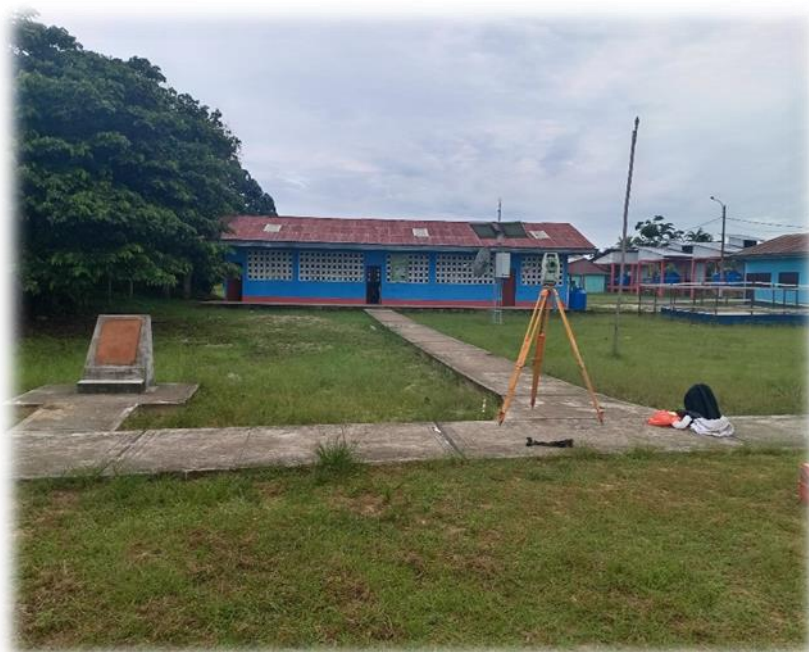
Foto N° 03: Vista de la localidad de El Lobo realizando levantamiento topográfico al detalle de veredas, lotes, buzones, etc