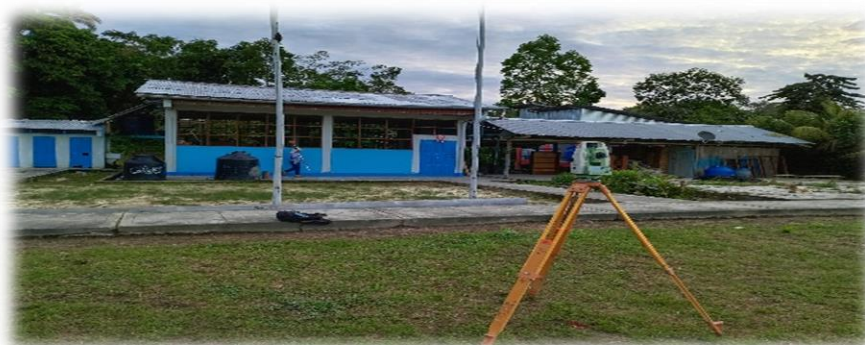
Foto N° 02: Vista de la localidad de Frontera realizando levantamiento topográfico al detalle de veredas, lotes, buzones, etc..