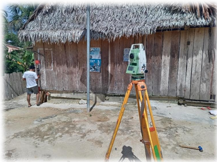
Foto N° 01: Vista de la localidad de Frontera realizando levantamiento topográfico al detalle de veredas, lotes, buzones, etc.