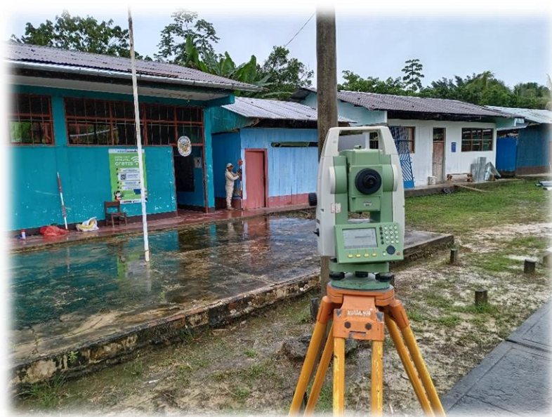
Foto N° 04: Vista de la localidad de Lobo realizando levantamiento topográfico al detalle de veredas, lotes, buzones, etc