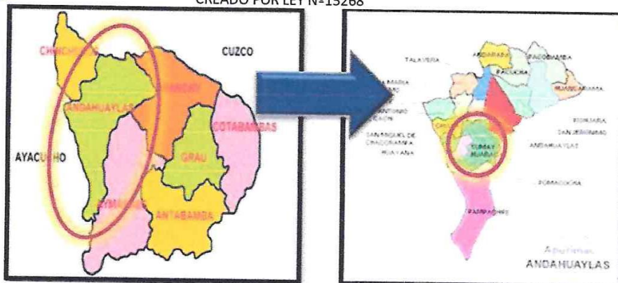
B. Ubicación Geográfica: