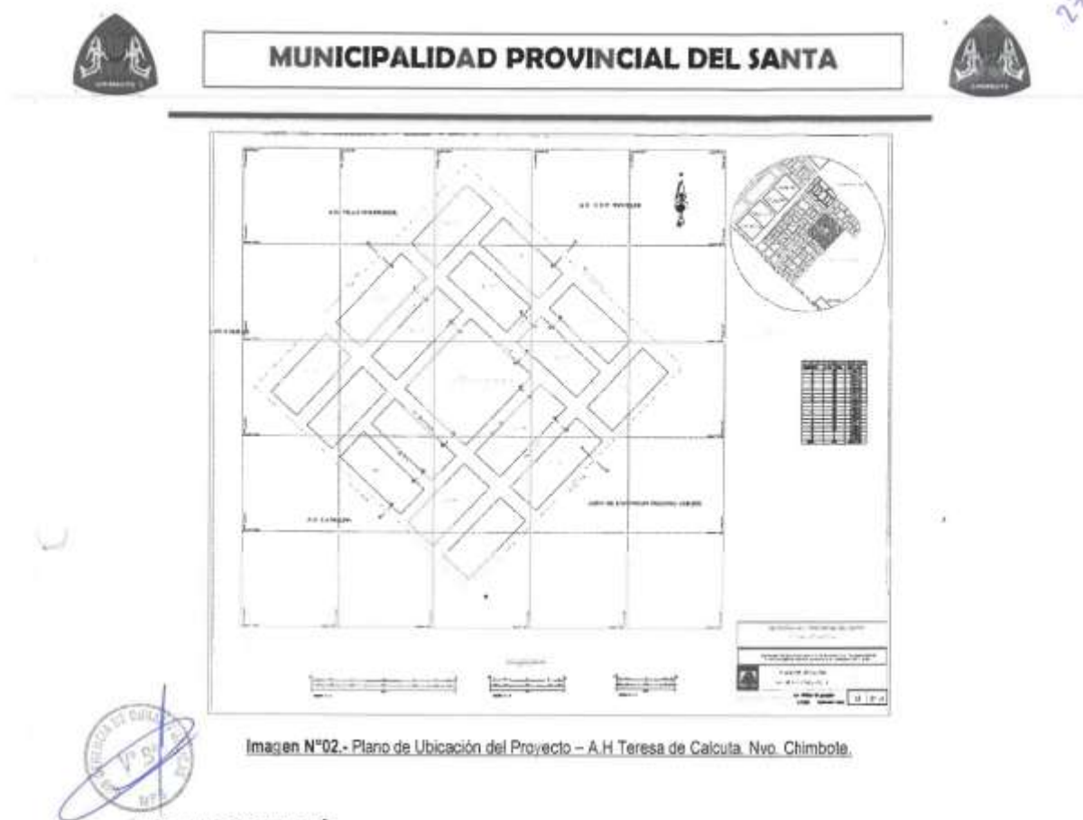
Imagen N°02.- Plano de Ubicación del Proyecto - A.H Teresa de Calcuta. Nvo. Chimbo.