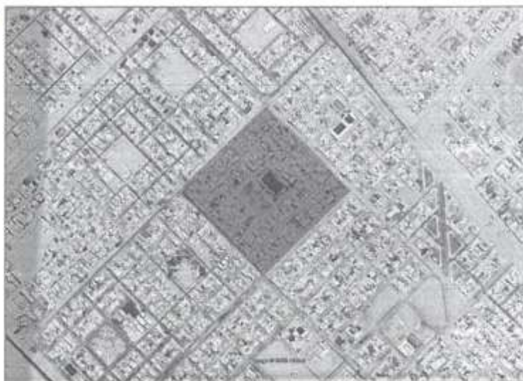
Imagen N°01.- Zona de Intervención (Polígono color Rojo)