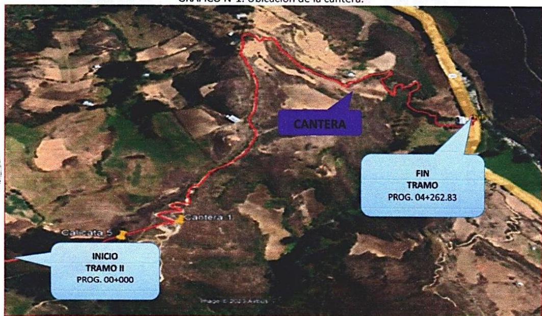
GRAFICO N°1: Ubicación de la cantera.

Se contempla el afirmado integral del tramo para un ancho de 4.50 m., con 0.20 m. de espesor en 2,874 m de longitud. El material a utilizarse procede de cantera situada en el tramo de la vía. Se ha identificado 01 puntos de extracción de material para el camino vecinal de superficie de rodadura a nivel de afirmado, en la carretera a la Caserío La Llica a 1,100.00 m del Punto Final del Tramo especificado en el Grafico N° 01. Como una de las labores previas al afirmado se debe efectuar la nivelación de la superficie que va a recibir el lastre o material para afirmado.