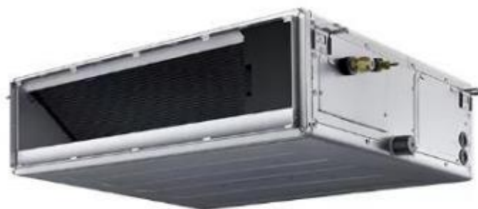
Imagen 01. Imagen referencial de unidades evaporadoras tipo Fancoil