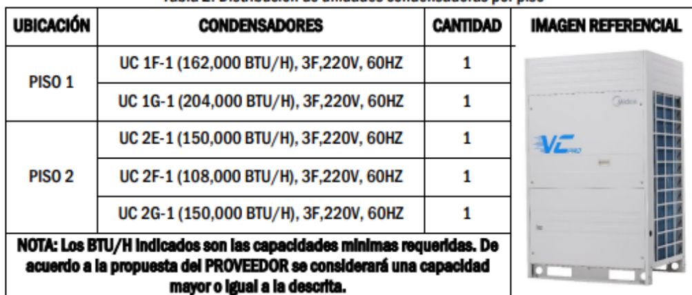
Tabla 2: Distribución de unidades condensadoras por piso

Las Unidades Condensadoras serán de expansión directa para operar con refrigerante ecológico R-410A, para trabajar en 220 V / 3 Ph / 60 Hz. Con compresor(es) de tipo Inverter (de velocidad variable) y sistema de control electrónico para responder a los distintos requerimientos de capacidad de enfriamiento. Todas las unidades que conforman una unidad condensadora deberán tener todos sus compresores Inverter.