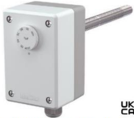
Imagen 6. Imagen referencial de sensor de humedad.

Deben registrar por lo menos 30% de humedad relativa en adelante, considerando que se requiere tener un rango probable de 30 a 60% de humedad.