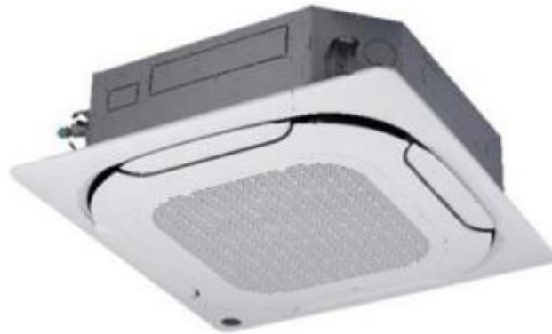
Imagen 03. Imagen referencial de unidades evaporadoras tipo Cassete