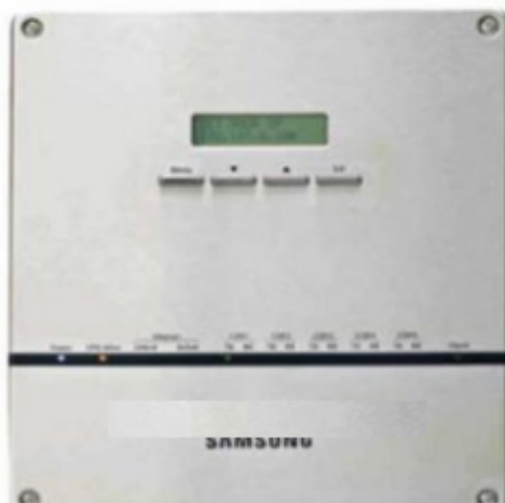
Imagen 5. Imagen referencial de unidades controladoras

*Considerando que los evaporadores cassette incorporen sensores de humedad.