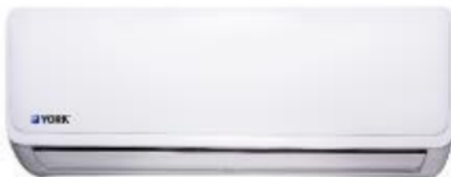
Imagen 4. Imagen referencial de unidades evaporadoras tipo Split