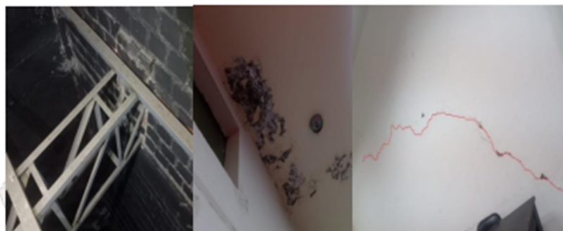
Figura 1. Deterioro estructural del centro cultural