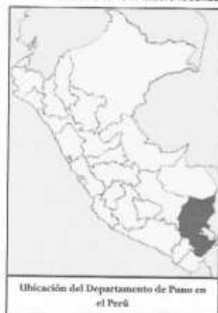
Grafico N° 01: Macro localización de la Provincia de San Antonio de Putina

En los siguientes mapas y croquis se aprecia la macro localización y micro localización del PIP.