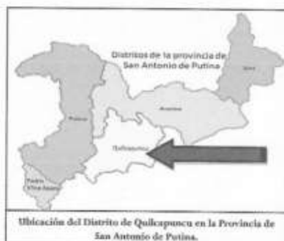
Gráfico N° 03: Localización de las Comunidades del Distrito de Quilcapuncu - COMBUCCO