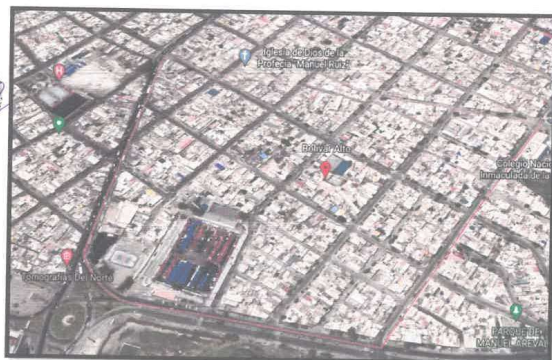
Imagen 04 - PUEBLO JOVEN BOLIVAR ALTO