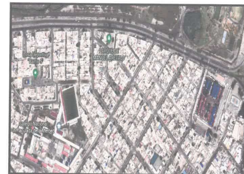
Imagen 01 - ASENTAMIENTO HUMANO MANUEL AREVALO