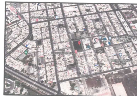
Imagen 05 - PUEBLO JOVEN EL ACERO