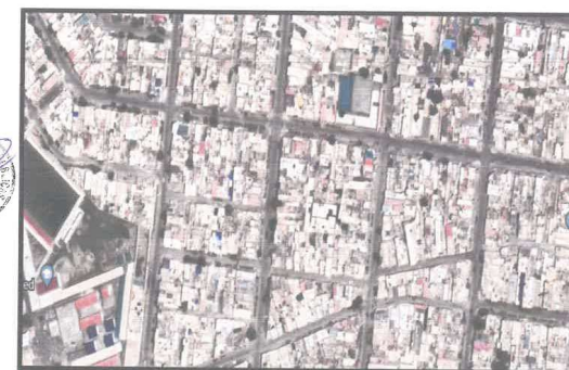
Imagen 02 - ASENTAMIENTO HUMANO RAMON CASTILLA