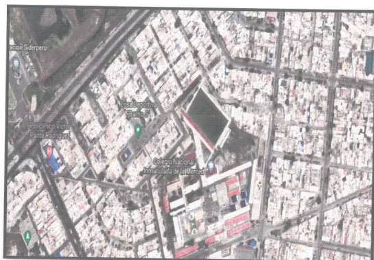
Imagen 03 - BARRIO FISCAL N°05