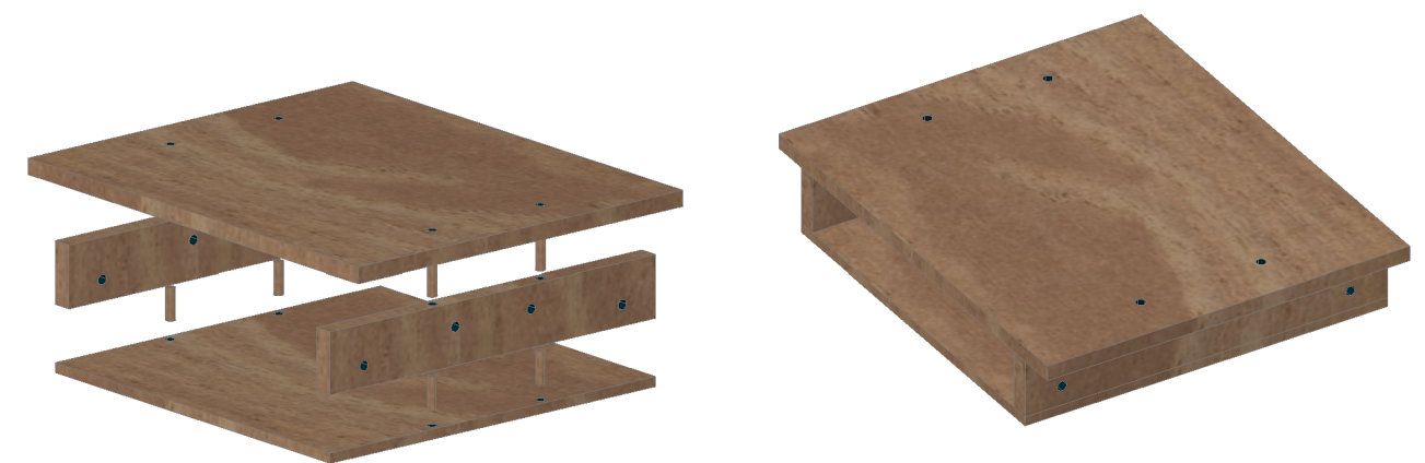
05 ENSAMBLAJE Escala: 1:10