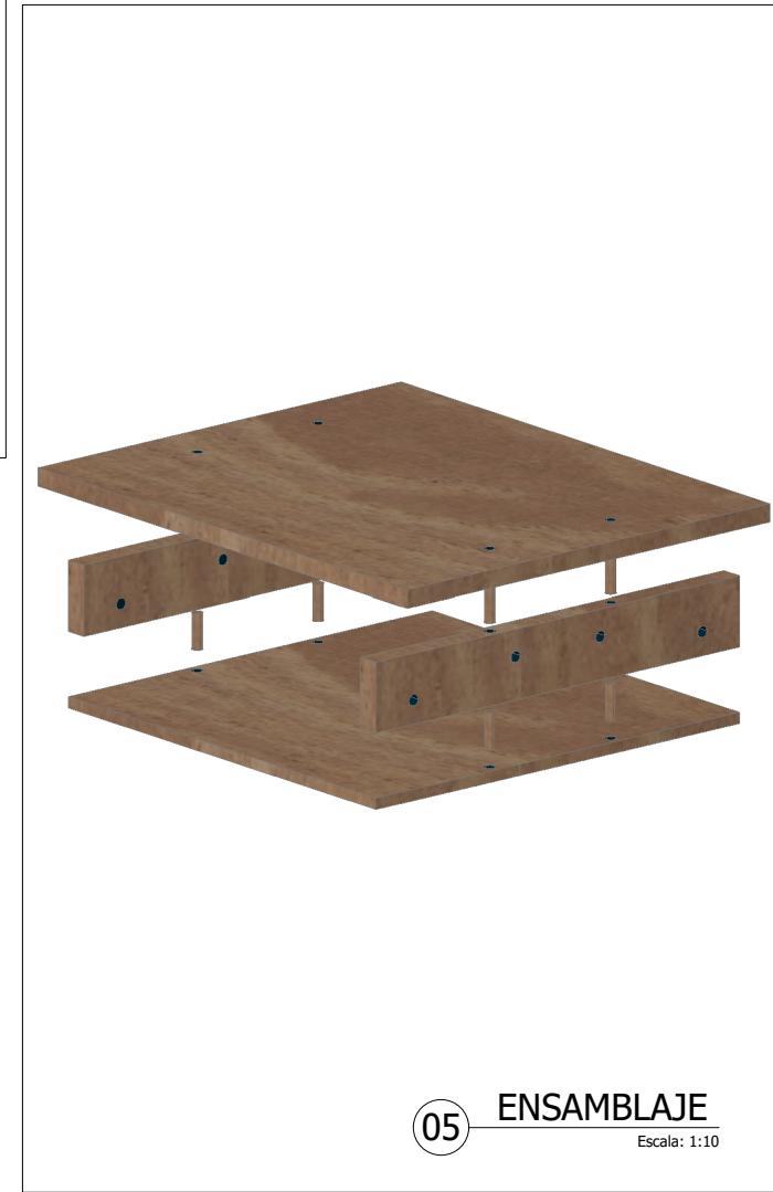
05 ENSAMBLAJE Escala: 1:10