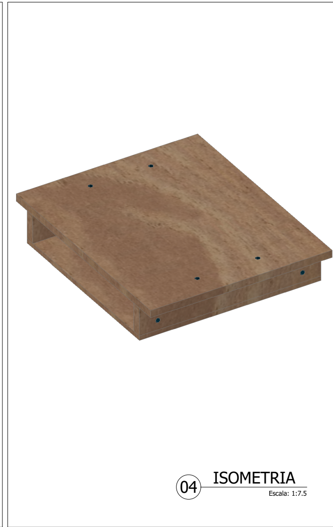
04 ISOMETRIA Escala: 1:7.5