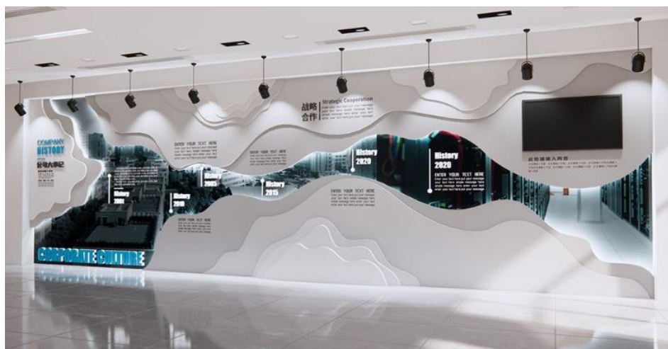
Imagen referencial de lo requerido

Fecha de montaje: 12 de diciembre, 2024 / Horario: 08:00am - 16:00pm