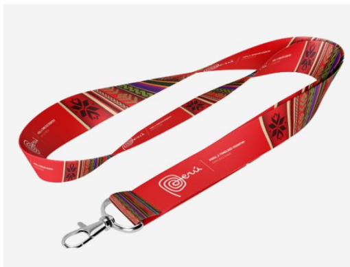
Imagen referencial de lo requerido