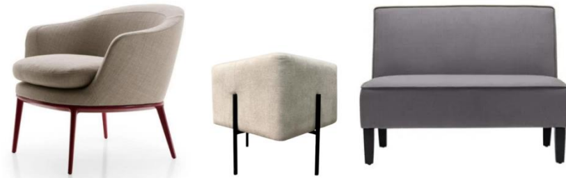
Imágenes referenciales de lo requerido