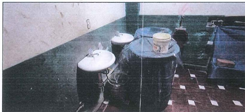
IMAGEN N° 02: SISTEMA DE ALMACENAMIENTO DE AGUA

del día impidiendo el uso de lavaderos cuando se carece de agua, contando que solo cuentan con agua potable entre 1 a 2 horas por días se ven obligados en almacenar agua en barriles de plástico.