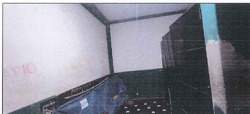
IMAGEN N° 03: ESTADO DE URINARIO EXISTEN Y PUERTAS DE SERVICIOS HIGIENICOS

Al carecer de presión suficiente para el para el funcionamiento del sistema de agua fría se ven en la necesidad de almacenar agua en barriles de plástico para el lavado de manos y el funcionamiento de los inodoros.