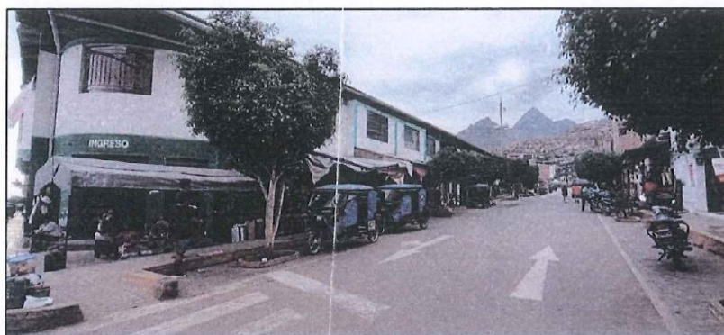
IMAGEN N° 06: FACHADA DE MERCADO EN EL PASAJE COMERCIO