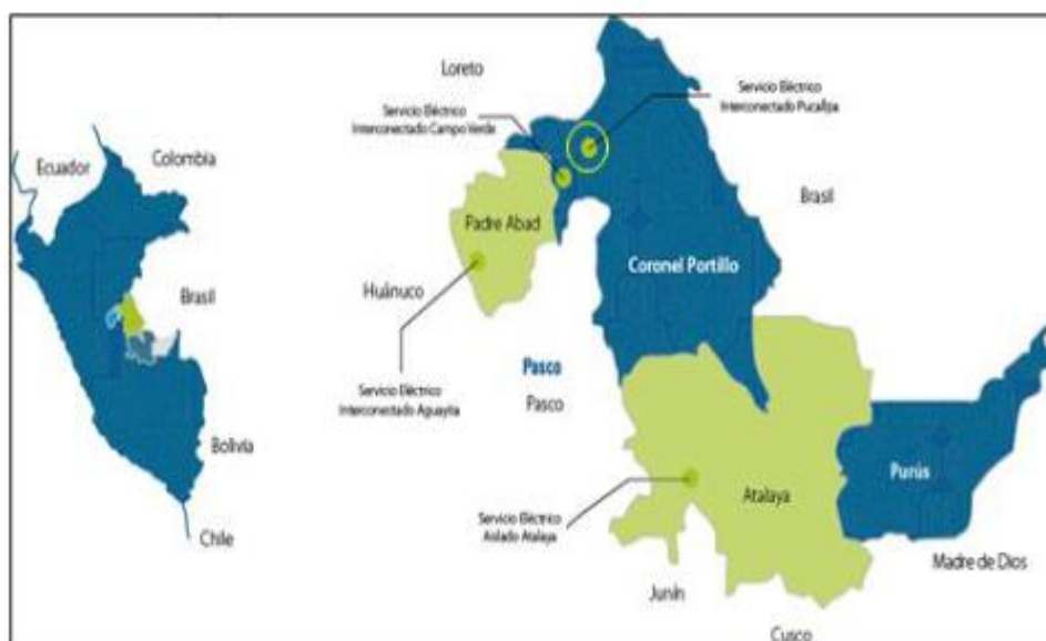
FIGURA N° 01: Ubicación del AA.HH. del Proyecto

En el gráfico siguiente se muestra donde se encuentra localizado el proyecto dentro del ámbito regional, provincial y su área de influencia directa.