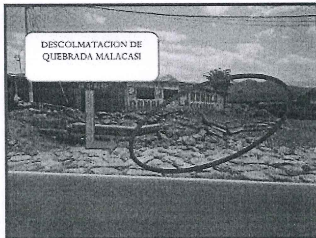
ESTADO SITUACIONAL DE LA "QUEBRADA MALACASI"

GERENCIA SUB REGIONAL MORROPON HUANCABAMBA CONTRATACION DIRECTA N°