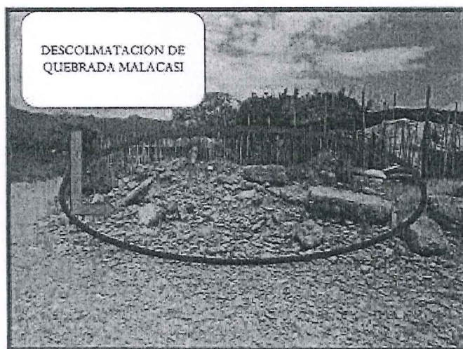
ESTADO SITUACIONAL DE LA "QUEBRADA MALACASI"