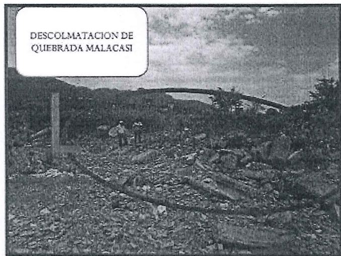
ESTADO SITUACIONAL DE LA "QUEBRADA MALACASI"