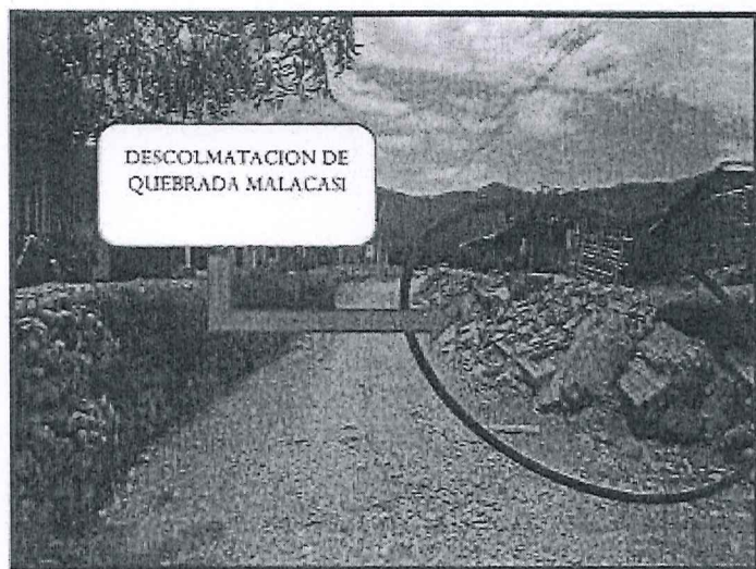
ESTADO SITUACIONAL DE LA "QUEBRADA MALACASI"