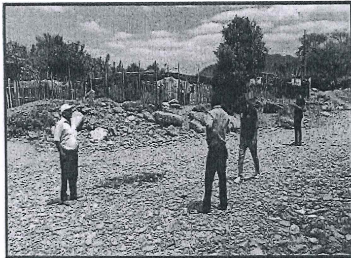
ESTADO SITUACIONAL DE LA "QUEBRADA MALACASI"

GERENCIA SUB REGIONAL MORROPON HUANCABAMBA CONTRATACION DIRECTA N°