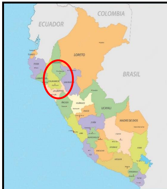
Imagen N°02: Ubicación departamental del proyecto.