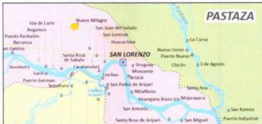
Figura N° 4 ÁREA DE ESTUDIO A REALIZAR