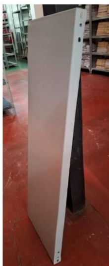
Imagen 2: Estantes del archivo del módulo.

Firmado digitalmente por QUINTERO OCHOA Raul FAU 20490770883 soft Motivo: Doy V° B° Fecha: 05.06.2025 17:16:14 -05:00