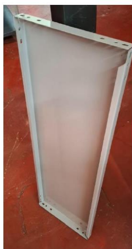
Imagen 3: perfil transversal de planchas laminadas forma L.

Firmado digitalmente por CACERES HUAYCOCHEA Ronald Gerardo FAU 20490770883 soft Motivo: Doy V° B° Fecha: 05.06.2025 17:26:09 -05:00