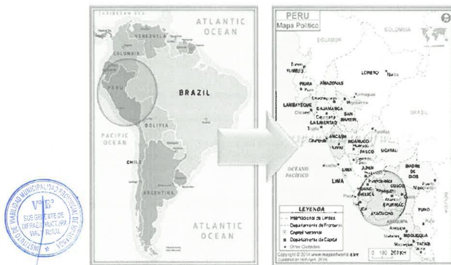
FIGURA N° 01 - MAPA DE UBICACIÓN MACRO